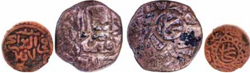
Resim 5: Şahruh Sultan (H. 807-850). Çapı 25.3 Ağırlığı 4. 5894 gr. Metal: AE. R.

Beşinci resim , ikinci sikke ile benzer stilistik özelliklerle kesilmiştir. Şahruh dönemine 38 aittir 832 tarihlidir, dengi darb Buhara'da bakır olarak darbedilmiştir, kondisyonu mükemmeldir. Sikkenin diğer tarafında Şahruh Sultan adı (Şahruhiye) yer almaktadır. Sene fit'tarih 832 şeklindedir. Bu sikkeler fülüs-ı adliye olarak bilinirler. Bir rare olarak tanımlanmıştır.