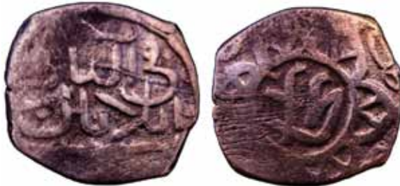
Resim 10: Çapı 24 mm, Ağırlığı 5. 8426 gr. Metal: AE. RR.