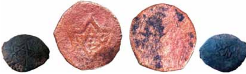
Resim 31: Çapı 17.5 mm, Ağırlığı 1.7624 gr. Metal: AE. RRRR.

Barskan bölgesinde bulunmuştur. Uzmanlar tarafından Timurîler (XV-XVI) ya da daha sonraki bir döneme tarihlenmektedir. Sikkenin ön yüzünde iki adet altı köşeli yıldız mevcuttur. Ortasında Muhammed (Mehmed-Mahmud) gibi bir yazı bulunmaktadır. Otrar şehrinde Hicri 832/1429 yılında darbedilmiş olmalıdır. Para Birimi: Yarım Tenkidir. www.zeno.ru. # 150939. 59