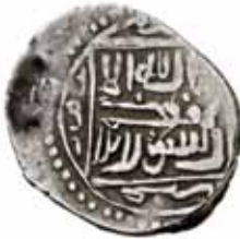
Timurîler, H. 804-806/1402-1404. Engüriyye (Ankara). Emiri azam/Timur Küregen/ Halledallahü mülkehu/Darb Engüriyye (1.33 gr).