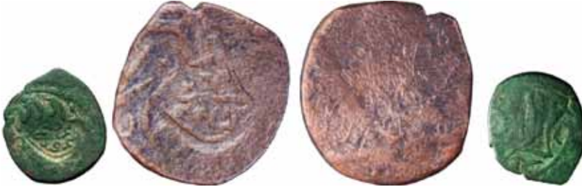
Resim 20: Çapı 20 mm, Ağırlığı 3. 6059 gr. Metal: AE. R.

Timur, Hicri 890-920/1494-1514, Darb yeri: Semerkand/Taşkend, Anonim Sikke. Barskan bölgesinde bulunmuştur.