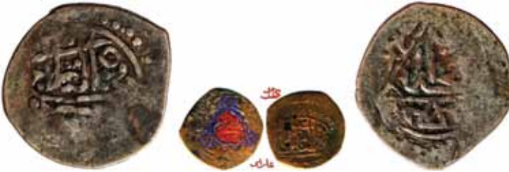
Resim 32: Çapı 26.5 mm, Ağırlığı 3.0227 gr. Metal: AE. RR.