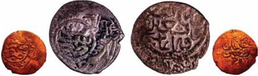
Resim 11: Mahmud (899-900). Çapı 25 mm, Ağırlığı 4. 8520 gr. Metal: AE. RR.

Yaklaşık Hicri 890/1485-910/1505 yılları arasında darbedilmiştir. Darb Yeri: Semerkand, Hicri 910/1505. Sikkenin üzerinde Adl, Semerkand yazılıdır. Anonim Sikke. www.zeno.ru. # 86509. 44