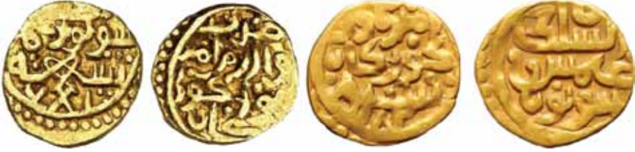
#79239: H. 781/1379 Khwarizm, fractional Dinar, Timur Citing the Chaghatayid ruler Suyurghatmish. #70344: H. 782/1380, Timur with Suyurghatmish. 13

Timur'un Anadolu üzerine hareketi öncesinde yaptığı askeri hazırlıklar sırasında teşkil edilen ordu için farklı eyaletlerden asker topladığı bilinmektedir. Namengan, Buhara, Semerkant, Buhara, Şaş (Taşkent), Mergulan, Andican, Harezmi, Fergana vd şehirlerden orduya katılan askerler için sefer öncesinde dağıtılan ücretler gümüş (dirhem) ve bakır (fels-fülüs) sikkelerden oluşmaktadır. Altın sikke farklı normlarda (dinar) nadiren görülmekte ve genellikle de sarayda kullanılmaktadır.