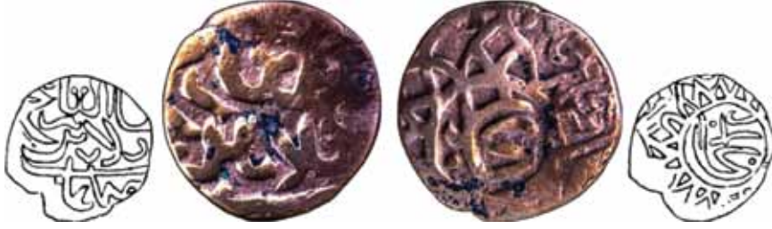
Resim 4: Şahruh Sultan (H. 807-850). Çapı 22 mm, Ağırlığı 4. 3001 gr. Metal: AE. R. Timuri-Sultan Şahruh, Darb Yeri: Buhara, Hicri 832/1429. www.zeno.ru. # 48481/8537. 37

Dördüncü resim , Sultan Mahmut (899-900) dönemine aittir. Sikke Semerkand şehrinde darbedilmiştir ve Hicri 898/899 tarihlidir. Anonim sikke olarak bilinen paranın ön yüzünde Semerkand, arka yüzünde ise sultanın adı zikredilmektedir.