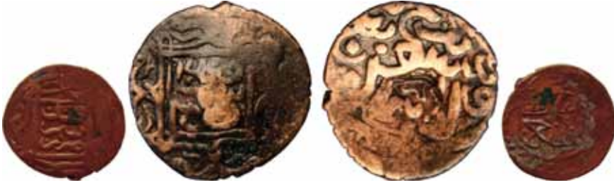
Resim 14: Mahmud (899-900). Çapı 24.5 mm, Ağırlığı 5. 1108 gr. Metal: AE. RR. Darb Yeri: Semerkand, Hicri 899/900/1494-1495, Anonim Sikke. 47