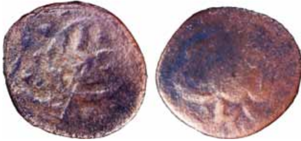
Resim 28: Çapı 24.5 Ağırlığı 3. 9215 gr. Metal: AE. RRRRR.