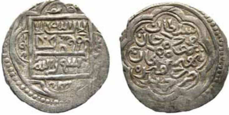
Çapı 17 mm, Ağırlığı 1,48 gr ağırlığındadır ve yüksek ayarlı gümüştür.

Kalıp cümle şeklinde sikkenin ön yüzünde görülen yerde La ilaha illallah Muhammed Resulallah, üstte Hz. Ebubekir, altta Hz. Osman, solda Hz. Ömer, sağda Hz. Ali yazılıdır. Emir Timur ve Sultan Mahmud Han adına Erzincan'da darbedilen sikkenin tarihi silinmiştir. (www.zeno.ru. #51211). 8