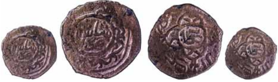
Resim 1: Çapı 26 mm, Ağırlığı 5. 3864 gr. Metal: (Bakır) AE.

İkinci resim, Şahruh dönemine aittir 832 tarihlidir, dengi darb Buhara'da bakır olarak kesilmiştir, kondisyonu mükemmeldir. Sikkenin diğer tarafında Şahruh Sultan adı yer almaktadır. Sene fit'tarih 832 şeklindedir. Bu sikkeler, fülüs-ı adliye olarak da bilinirler. Nadirlik derecesi bir rare (R) olarak tanımlanmıştır. Şahruh sikkeleri görüldüğü üzere Astarabad, Yezid, Kaşan, Kirman, Sebizvar, Sova (Sava), Semerkand, Sultaniye, Tebriz ve Şiraz şehirlerinde darbedilmiştir. 29 Bu sikke 4, 5, 9, 10, 12, 21, 26 nolu sikkelerle aynı şekilde darb edilmiştir. Zikredilen sikkelerin tamamı Hicri 832 yılına aittir.