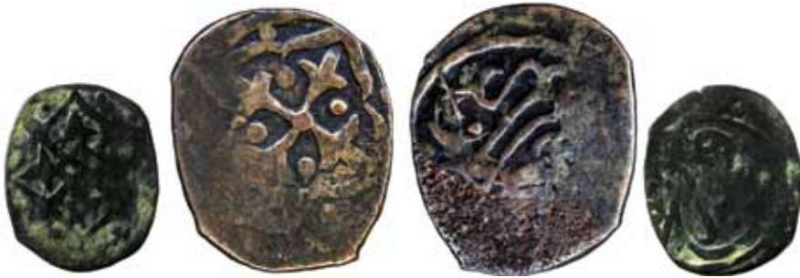
Resim 7: Çapı 21.5 mm, Ağırlığı 2. 9445 gr. Metal: AE. R.

Timurî/Moğol, Darb Yeri: Belh. . www.zeno.ru. # 158770/133414. 41