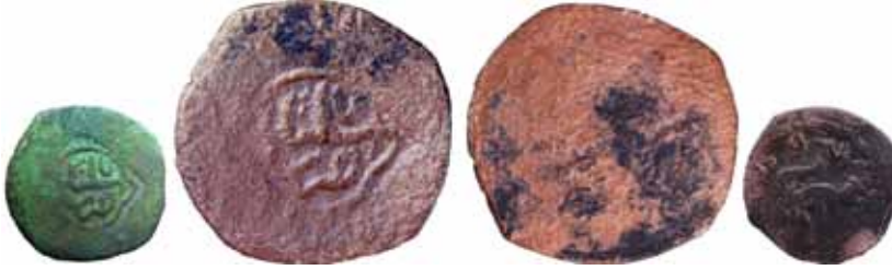
Resim 25: Çapı 20 mm, Ağırlığı 1. 5358 gr. Metal: AE. RRR.

Barskan (Barsgan) bölgesinde bulunmuştur. Darb yeri Şaş (Taşkend), Hicri 906/964/1501-1557. Sikke, Mahmud Han dönemi ya da Mogulistan hanı Tuğluk Timur dönemine ait olabilir. Sikkenin üzerinde Şaş-Taşkent yazısının yanı sıra diğer tarafında aslan-pars resmi vardır.