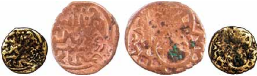
Resim 21: Şahruh Sultan (H. 807-850). Çapı 26 mm, Ağırlığı 5. 1319 gr. Metal: AE. R.

Timurî, Semerkand, Hicri 832/1429, Anonim Sikke. www.zeno.ru. # 104332. 52