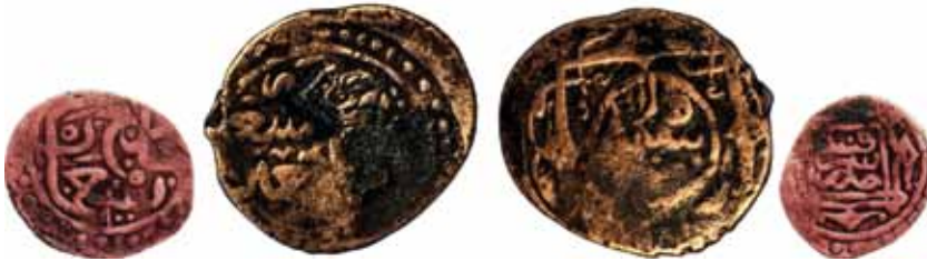
Resim 22: Mahmud (899-900). Çapı 26.8 mm, Ağırlığı 4. 6911 gr. Metal: AE. RR.

Timurî, Darb Yeri: Semerkand, Hicri 900/1495, Anonim Sikke. www.zeno.ru. # 97281/79919. 53