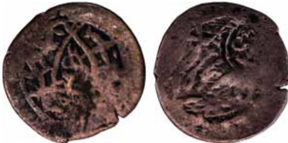
Resim 16: Çapı 25 mm, Ağırlığı 3. 7728 gr. Metal: AE. RRR. XIV-XVI. yüzyıla aittir, Darb Yeri: Taşkent'tir, balık figürlü bir sikke şeklinde darbedilmiştir.