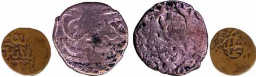
Resim 9: Şahruh Sultan (H. 807-850). Çapı 23.5 mm, Ağırlığı 6. 0565 gr. Metal: AE. R.

Timurî-Sultan Şahruh, Darb Yeri: Buhara, Hicri 832/1429. Anonim Sikke. www.zeno.ru. # 48481 . 43