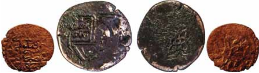
Resim 15: Şahruh Sultan (H. 807-850). Çapı 23 mm, Ağırlığı 4. 0268 gr. Metal: AE. RRR. Timuri, Uluğbek, Darb Yeri: Semerkand/Binkath, Hicri 832/1429 (?), Anonim Sikke. www.zeno.ru. # 16247/36669/9464. 48