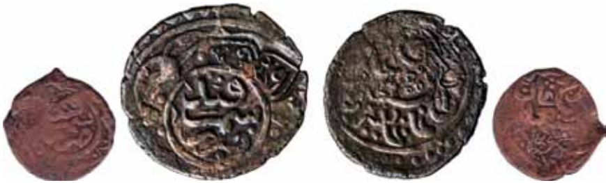
Resim 3: Mahmut (899-900). Çapı 25.5 mm, Ağırlığı 4. 8310 gr. Metal: AE. R.

Üçüncü resim, Timur sikkeleri ile Afgan sikkeleri arasında özel bir tip olarak karşımıza çıkmaktadır. Daha çok Timur'un hâkimiyeti altındaki topraklar arasında yer alan Hisar sikkelerine benzemektedir. Meskûkât uzmanları benzeri sikkelerin Afganistan topraklarında Timur'a tabi olan yerel beyler tarafından da darbedilmiş olabileceğini belirtmektedirler. Bakırdır ve çiçek süslemeleri ile nakşedilmiştir, diğer yüzünde Semerkand yazısı bulunmaktadır. Bu sikke ile 11 numaralı sikke aynı tarihlere aittir, sadece aralarında stil farkı mevcuttur.