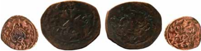
Resim 24: Çapı 29 mm, Ağırlığı 4. 4237 gr. Metal: AE. RR.