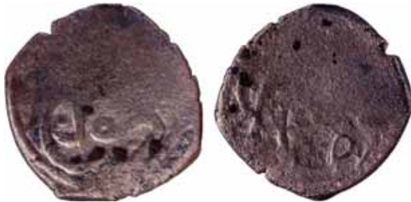
Resim 29: Çapı 24.5 mm, Ağırlığı 5. 6800 gr. Metal: AE.