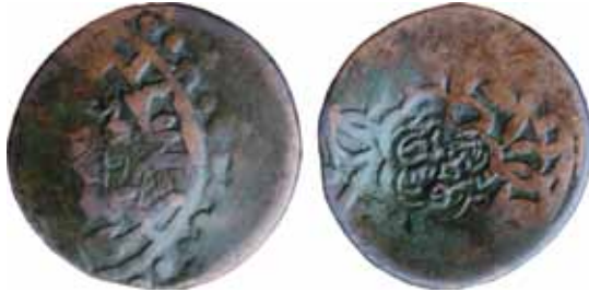
Resim 19: Mahmud (899-900). Çapı 24. 7 mm, Ağırlığı 4. 5429 gr. Metal: AE. RR. Timur, Hicri 899/1494, Anonim Sikke, Adl, Semerkand . www.zeno.ru. # 97271. 51