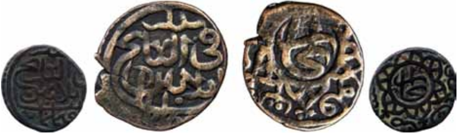
Resim 2: Şahruh Sultan (807-850) Çapı 25.5 mm, Ağırlığı 5. 3472 gr. Metal: AE. R. 30

İkinci resim, Şahruh dönemine aittir 832 tarihlidir, dengi darb Buhara'da bakır olarak kesilmiştir, kondisyonu mükemmeldir. Sikkenin diğer tarafında Şahruh Sultan adı yer almaktadır. Sene fit'tarih 832 şeklindedir. Bu sikkeler, fülüs-ı adliye olarak da bilinirler. Nadirlik derecesi bir rare (R) olarak tanımlanmıştır. Şahruh sikkeleri görüldüğü üzere Astarabad, Yezid, Kaşan, Kirman, Sebizvar, Sova (Sava), Semerkand, Sultaniye, Tebriz ve Şiraz şehirlerinde darbedilmiştir. 29 Bu sikke 4, 5, 9, 10, 12, 21, 26 nolu sikkelerle aynı şekilde darb edilmiştir. Zikredilen sikkelerin tamamı Hicri 832 yılına aittir.