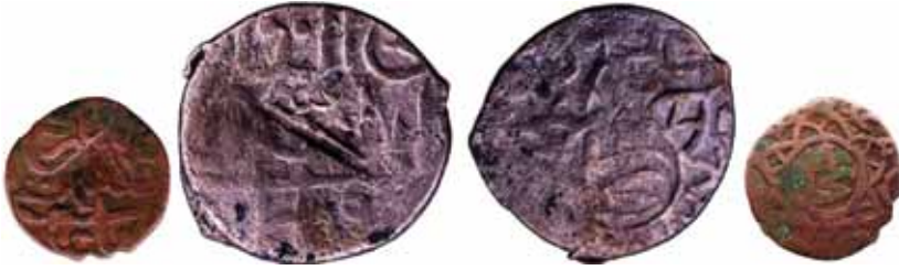
Resim 26: Şahruh Sultan (H. 807-850). Çapı 26 mm, Ağırlığı 6. 6489 gr. Metal: AE. R.

Anonim Sikke, Darb Yeri: Buhara, Hicri 832/1429. www.zeno.ru. # 104332 . 57