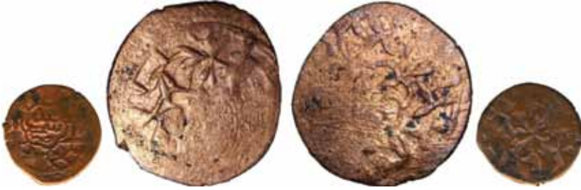
Resim 27: Sultan Hüseyin (873-911). Çapı 25.3 mm, A 4. 5886 gr. Metal: AE. RRR.

Darb Yeri: Semerkand, Hicri 901/906/1496-1501,