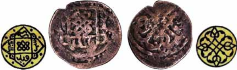
Resim 18: Çapı 24.8 mm, Ağırlığı 4. 6728 gr. Metal: AE. RR. Timurî, Darb Yeri: Semerkand, Hicri 910/1505, Anonim Sikke, Para Birimi: Dinar. www.zeno.ru. # 67499/33885/58310. 50