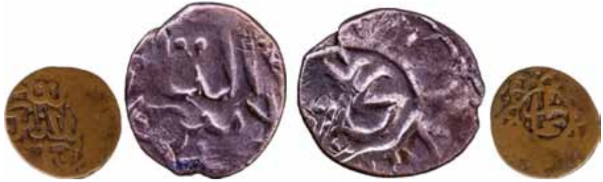
Resim 12: Şahruh Sultan (H. 807-850). Çapı 23 mm, Ağırlığı 4. 7857 gr. Metal: AE. R.

Timurî-Sultan Şahruh, Darb Yeri: Buhara, Hicri 832 (1428/9).