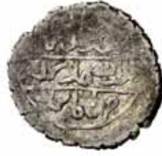
Timurîler, H. 804-806/1402-1404. Amasiya (Amasya). Emiri azam/Timur Küregen/ Halledallahü mülkehu/Darb Amasiya (1.67 gr). 19