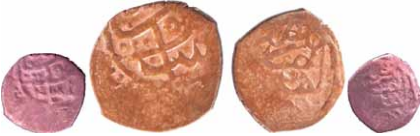
Resim 17: Çapı 26 mm, Ağırlığı 4. 4114 gr. Metal: AE. RRRRR. Anonim Timurî Sikkesi, Şaş (?).www.zeno.ru. # 72224. 49