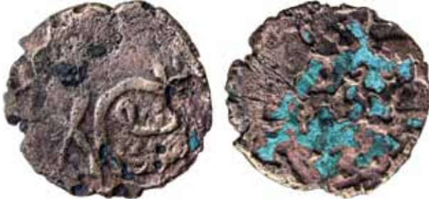
Resim 30: Çapı 24 mm, Ağırlığı 3. 6391 gr. Metal: AE.