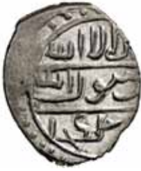
Timurîler, H. 806-808/1404-1406. Timur Han Küregen/Muhammed ibn Bayazıd Han/Halledallahü mülkehü Bursa (1.17 gr).

Bunun yanı sıra onun döneminde ya da daha sonra az da olsa Timur adına kesilen sikkeler vardır ki bunlar arasında bakır ve bronz alaşımlılarda bulunmaktadır. Aşağıda Anadolu'nun farklı şehirlerinde darbedilen sikke örnekleri verilmiştir.