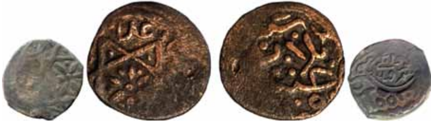
Resim 8: Şahruh Sultan (H. 807-850). Çapı 20.5 mm, Ağırlığı 4. 4878 gr. Metal: AE. R.

Timurî, Darb Yeri: Semerkand (ayrıca aynı sikkeler Buhara, Karşi, Termiz, Harizm, Şehrisebz, Şahruhiye'de de darbedilmiştir), Hicri 823/1420, Ölçü Birimi: Nim dengi: Adliye. Anonim Sikke.