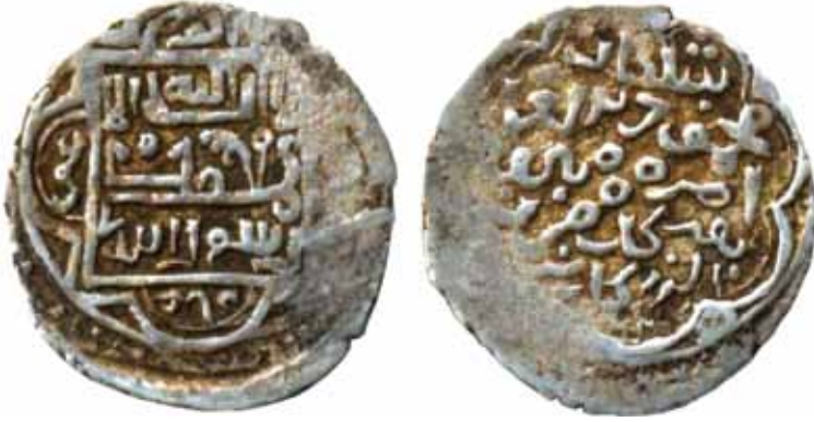
Sikkenin çapı 17-18 mm, 1.7 gr ağırlığındadır ve yüksek ayarlı gümüştür.

Kalıp cümle şeklinde sikkenin ön yüzünde görülen yerde La ilaha illallah Muhammed Resulallah, üstte Hz. Ebubekir, altta Hz. Osman, solda Hz. Ömer, sağda Hz. Ali yazılıdır. Emir Timur ve Sultan Mahmud Han adına Erzincan'da darbedilen sikkenin tarihi silinmiştir. (www.zeno.ru. #51211). 8