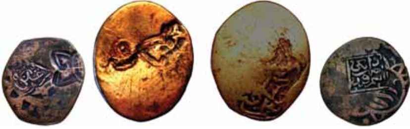
Resim 23: Sultan Hüseyin (873-911). Çapı 24 mm, Ağırlığı 4. 1836 gr. Metal: AE. RRR.

Hicri 902/1497, Semerkand/Hisar/Herat. Süslemeli Hisar sikkesi. www.zeno.ru. # 4080/58384 . 54