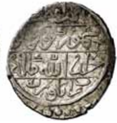
Timurîler, H. 804-806/1402-1404. Engüriyye (Ankara). Emiri azam/ Timur Küregen/Halledallahü mülkehü/ Darb Engüriyye.