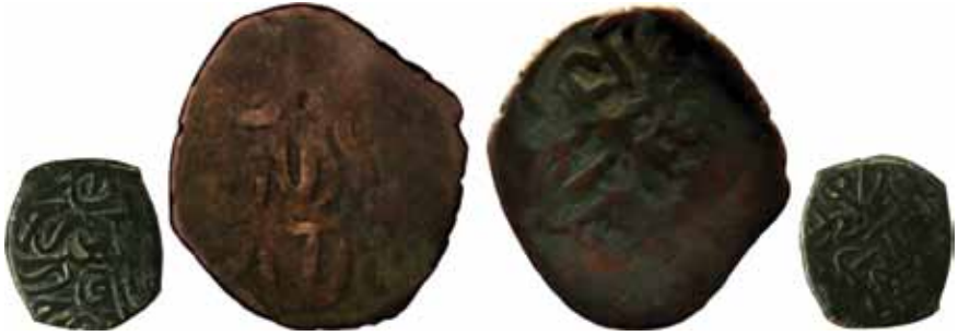
Resim 6: Çapı 28 mm, Ağırlığı 4. 3948 gr. Metal: AE. RRRR.

Timurî, Anonim Sikke. www.zeno.ru. # 44679. 40