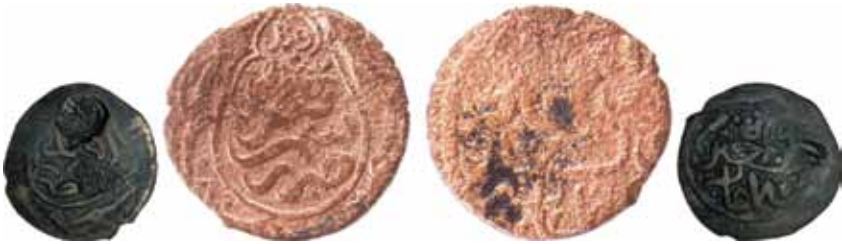
Resim 13: Mahmud (899-900). Çapı 23 mm, Ağırlığı 3. 7901 gr. Metal: AE. R.

Darb Yeri: Semerkand-Taşkend, Hicri 899-900/1494-1495,