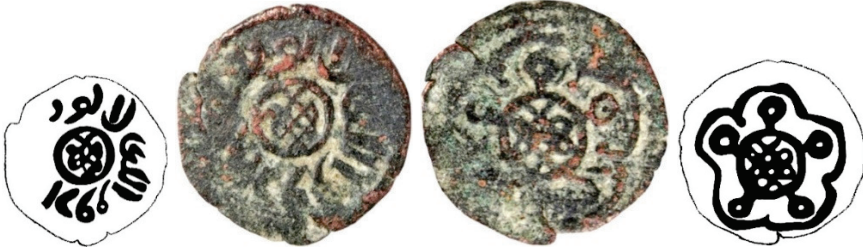
Resim 12. Ç.:18.17.8 mm, A.:1.565 gr. AE. RRRR. Fels.

Ön yüzünde çember içinde saadet düğümü, etrafındaki yazıda sultan-ı Erzurum ?, arkasında çember içinde saadet düğümünün kenarlarında beş yapraklı-pentafoil yer almaktadır. Sikkenin bugüne kadar literatüre kaydedilmiş okunabilir bir örneği tespit edilememiştir. Bulduğu yerin Erzurum olması sebebiyle, Mutaharten ya da İlhanlı sikkesi şeklinde kabulü söz konusudur. Kâmil Eron tarafından Anonim İlhanlı felsi olarak sınıflandırılmıştır (Zeno 257127).