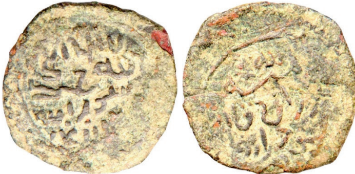
Resim 15. Ç.:20x19.5 mm, A.:2.092 gr. AE. RR. Fels.

لا اله الا الله محمد رسول الله ضرب ارزنجان المنة الله غازان قان محمود