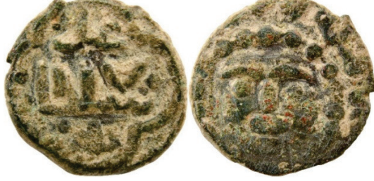
Resim 4. Ç.:14.x13 mm, A.:1.939 gr. AE. RRRRR. Fels.

لعادل سلطان حلد ضرب ارزروم لاله الله محمد رسول الله