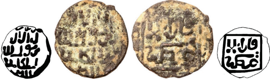
Resim 9. Ç.:18.5x17.5 mm, A.:1.864 gr. AE. RRRRR. Fels.

سيواس لاله الا الله محمد رسول الله السلطان ملك الله قان لاعظم