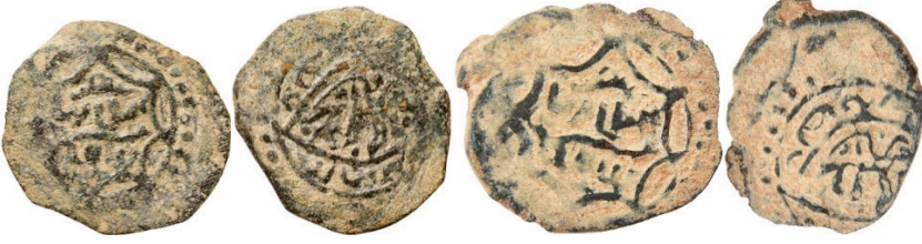
Resim 18. Ç.:18.7 mm, A.:1.40 gr. AE. RR. Fels.