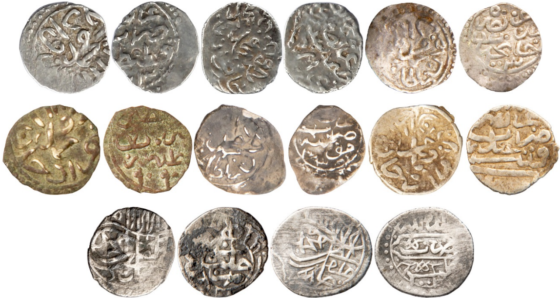
Sikke Nu.95:Ç.:11 mm, A.:0.263 gr. AR. Akçe. Sikke Nu.96:Ç.:11.5X10 mm, A.:0.338 gr. AR. Akçe. Sikke

۱۰۱ حلد ملکه ضرب خالب سنه ۱۰۰۳ ۱۰۲ حلد ملکه ضرب خالب سنه ۱۰۰۳