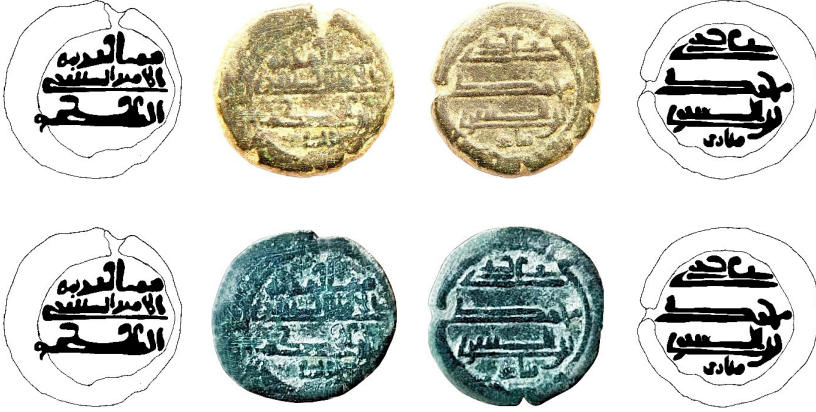
Resim 3a-b. Ç.:15.5x14.8 mm, A.:2.863 gr. AE. Ünik. Fels

مما أمر به الأمير الصاری بن الحكم علی يد محمد بن الصاری