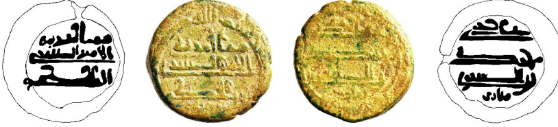
Resim 4. Ç.:14.9 mm, A.:2.55 gr. AE. Ünük. Fels

مما أمر به الأمير الصاری بن الحكم یزید علی يد محمد بن الصاری زیاد بسم الله ضرب هذالفلوس بمصر