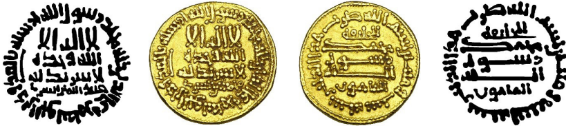
Resim 10. Ç.:18 mm, A.:4.25 gr. AU. R. Dinar (Zeno:280050/ME:92-29/AHB:27-247)

لاله الله وحده لا شريك له محمد الصارى محمد رسول الله ارسله بالهدى ودين الحق ليظهره على الدين كله للخليفة محمد رسول الله المامون بسم الله ضرب هذا الدينار سنة ستة ومانتان