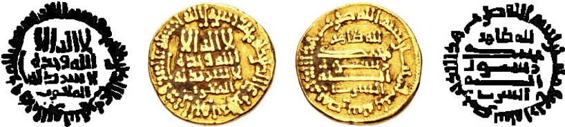
Resim 7. Ç.: 17.5x18 mm, A.:4.26 gr. AU. C. Dinar (Zeno:35575/262264/CNG:527-504/ANS:1971.49.217)

لاله الاله وحده لا شريك له المغرب محمد رسول الله ارسله بالهدى ودين الحق ليظهره على الدين كله لله ظاهر محمد رسول الله الصارى بسم الله ضرب هذا الدينار سنة ثلاثة و مائتان