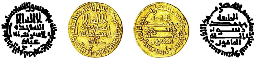
Resim 2. Ç.:18 mm, A.:4.23 gr. AU. S. Dinar

محمد رسول الله المامون بسم الله ضرب هذا الدينار سنة سبع وتسعين ومائة