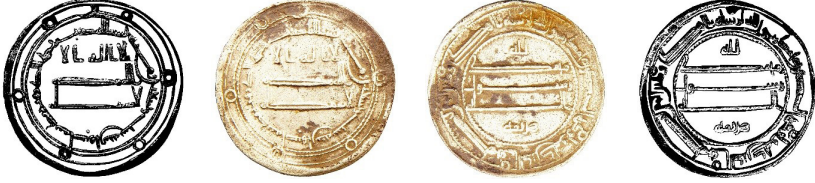
Resim 1. Ç.:22.1x22 mm, A.:2.827 gr. AR. RR. Dirhem

لااله الاالله وحده لا شريك له بسم الله ضرب هذا الدرهم بمدينة اصبهان سنة ستة وتسعون ومائة الله محمد رسول الله ارسله بالهدى ودين الحق ليظهره على الدين كله ولو كره المشركون هرثمة