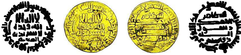
Resim 5. Ç.:17x18 mm, A.:4.21 gr. AU. C. Dinar

لااله الاالله وحده لا شريك له الصارى محمد رسول الله ارسله بالهدى ودين الحق ليظهره على الدين كله الله ظاهر محمد رسول الله ذوالرناستين بسم الله ضرب هذا الدينار سنة مانتان