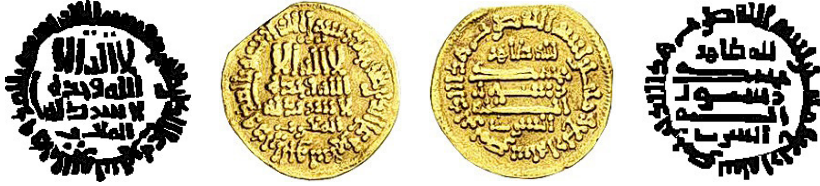
Resim 8. Ç.:18 mm, A.:4.25 gr. AU. C. Dinar (Zeno:45467/LN:17-3504)

لااله الاالله وحده لا شريك له الصارى محمد رسول الله ارسله بالهدى ودين الحق ليظهره على الدين كله لله ظاهر محمد رسول الله نوالرناستين بسم الله ضرب هذا الدينار سنة اربع ومانتان