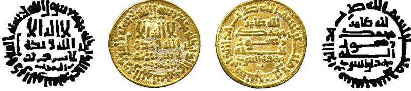
Resim 9. Ç.:18 mm, A.:4.25 gr. AU. R. Dinar

لاله الله وحده لا شريك له المغرب محمد رسول الله ارسله بالهدى ودين الحق ليظهره على الدين كله لله ظاهر محمد رسول الله محمد الصارى بسم الله ضرب هذا الدينار سنة خمس ومانتان