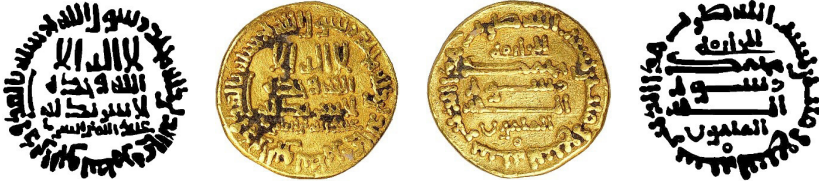
Resim 11. Ç.:18 mm, A.:4.22 gr. AU. S. Dinar

لااله الاالله وحده لا شريك له عبدالله بن الصاري محمد رسول الله ارسله بالهدى ودين الحق ليظهره على الدين كله للخليفة محمد رسول الله المامون بسم الله ضرب هذا الدينار سنة تسعة ومانتان