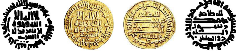
Resim 6. Ç.:18 mm, A.:4.23 gr. AU. S. Dinar (Zeno:77694/45505/ LN:16-4401)

لاله الاله وحده لا شريك له الصارى محمد رسول الله ارسله بالهدى ودين الحق ليظهره على الدين كله لله ظاهر محمد رسول الله ذوالرناستين بسم الله ضرب هذا الدينار سنة مائتان وواحد